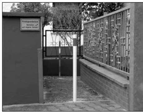
Poller stehen auf privatem Grund.

Kirchgasse nicht nötig sei und die Situation im Bereich Schustergasse nicht verändern wird. Der zweite, auf Gemeindegrund stehende Poller, soll nach einstimmigem Beschluss des Rates entfernt werden.