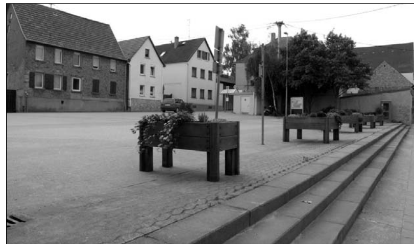
Der "Freie Platz" ist so kein Aushängeschild für Köngernheim